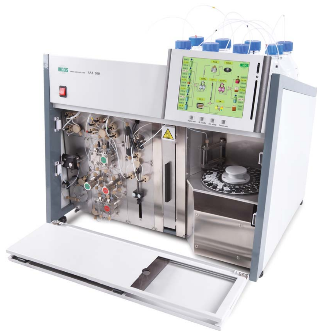
Amino Acid Analyzer AAA500 / Автоматические анализаторы аминокислот AAA500