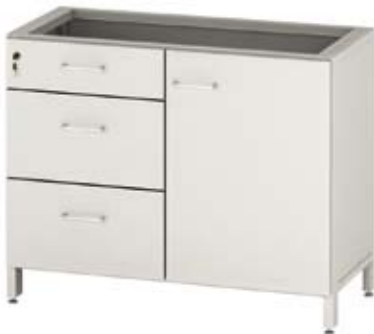
ЛАБ-ПРО ТОМДЯ 116.50.86

Длина – 860, 1160, 1460 мм Глубина – 500 мм Высота – 860 мм