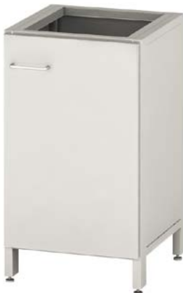
Тумба одинарная металлическая с дверкой

Длина – 500 мм Глубина – 500 мм Высота – 860 мм