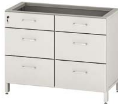
ЛАБ-ПРО ТОМЯЯ 116.50.86