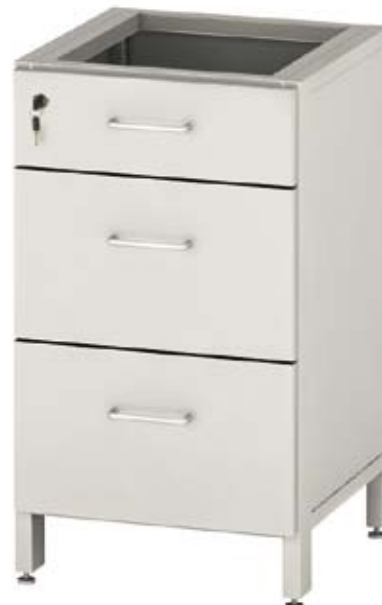
Тумба одинарная металлическая с ящиками